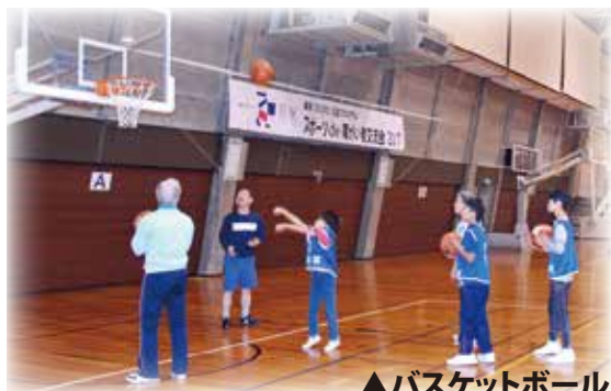
▲バスケットボール