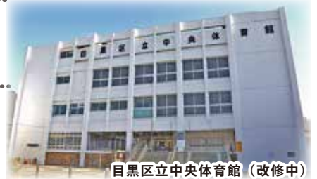
目黒区立中央体育館 (改修中)