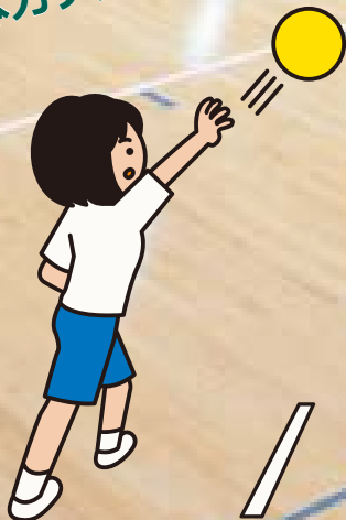
ソフトボール投げ